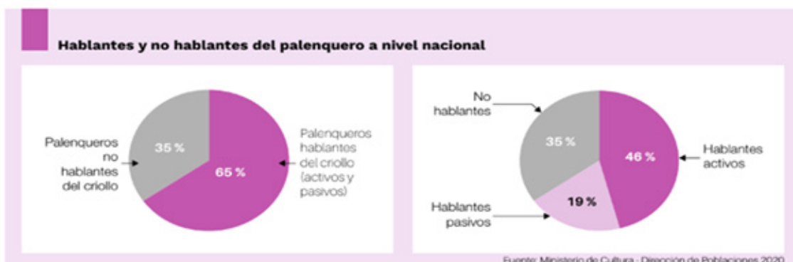
Infografía 1. Tomado del Ministerio de Cultura (2022, p. 99)

Con todo lo anterior, se evidencia la existencia de dos códigos lingüísticos en palenque: el español y la lengua criolla palenquera, la cual cuenta con una base lexicadora de lenguas romances (español y portugués) y con una estructura morfosintáctica que proviene de lenguas africanas, especialmente del kibundo y el kikongo de la familia lingüística bantú. El contacto entre estas dos lenguas define claramente un proceso de diglosia por la separación social y lingüística entre estas dos lenguas (Plan decenal de lenguas nativas.2022).