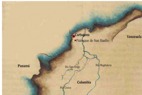
San Basilio de Palenque.

Según Hurtado (2020), la lengua palenquera es hablada en diferentes lugares de Colombia, principalmente en San Basilio de Palenque. Este lugar es conocido por su historia y cultura, ya que fue un importante centro de trata esclavista durante la época de la Conquista y la Colonia. Además de San Basilio de Palenque, se han identificado hablantes del palenquero en otros asentamientos de la diáspora, como Barranquilla, Cartagena y otras localidades. Escobar (2019) afirma que esta lengua, es una de las más antiguas de América y ha sido objeto de estudio por parte de lingüistas y antropólogos debido a su singularidad y su importancia cultural. En relación a lo anterior, González y Quintero (2019) afirman que el criollo palenquero se caracteriza por ser un sistema lingüístico que ha experimentado una evolución a lo largo del tiempo. Debido a su origen histórico y a la influencia de diferentes lenguas, presenta una mezcla de léxico proveniente de lenguas africanas, especialmente del grupo de lenguas bantúes, así como del portugués, del italiano y del español. Los autores analizan la presencia de estos elementos léxicos y su contribución a la diversidad lingüística y cultural de la comunidad palenquera.